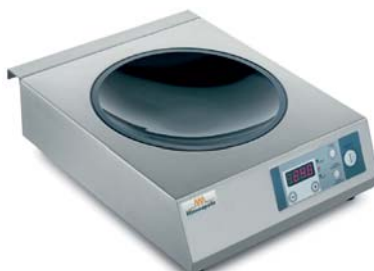
IH 35 WOK