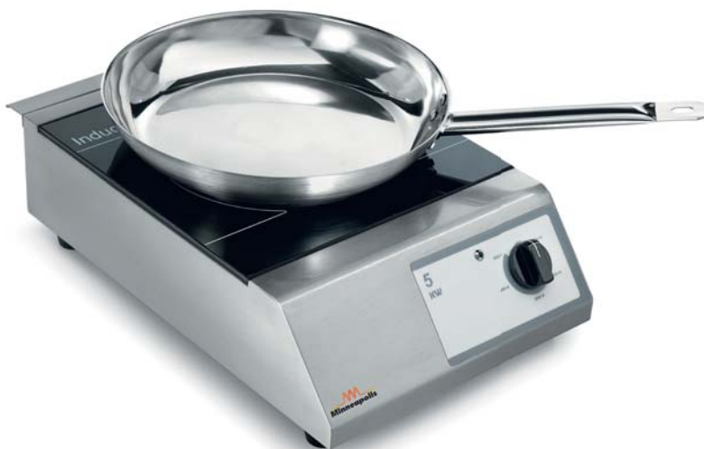
PI 5.0 KW